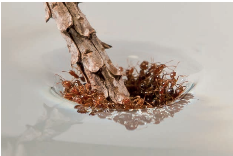
Abb. 4 Das Ameisenfloß ist äußerst robust und verkraftet erhebliche Störungen.

Einmal mehr lehrt uns die Schöpfung, wie Probleme gelöst oder auf Störungen effektiv reagiert werden kann. Auch und gerade in den kleinsten Lebewesen stecken erstaunliche Fähigkeiten und eine überraschende Kreativität.